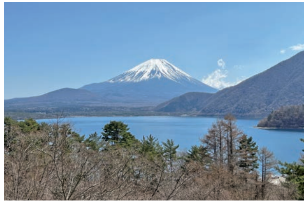
本栖湖からの景色