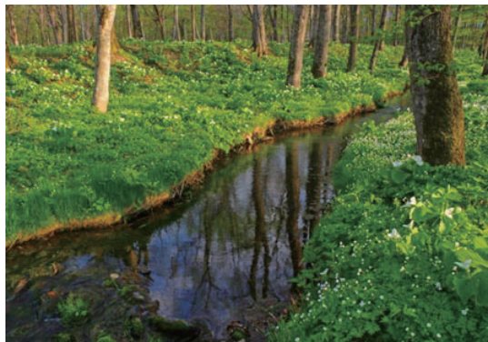
小川に群生する二輪草 さて花言葉は？