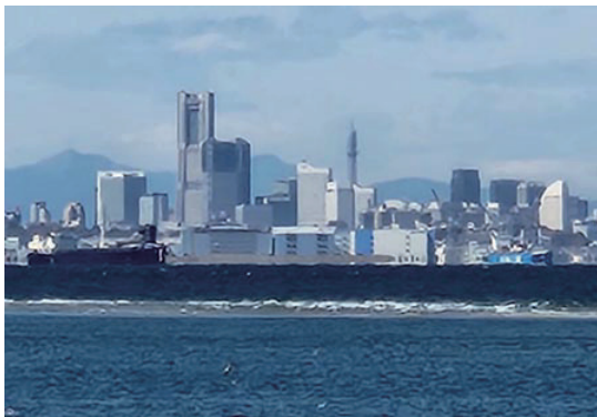
奥に見えるのが丹沢の山々です