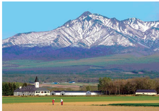
輝かしい陽春の訪れ