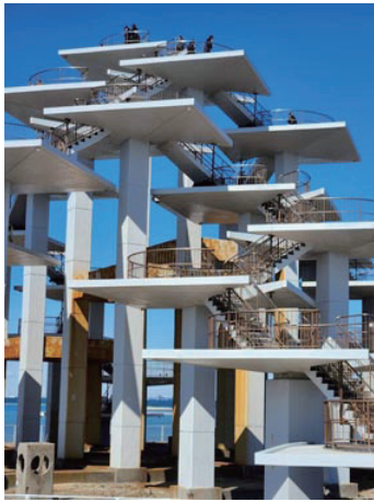
明治百年記念展望塔モチーフとなつたのは五葉松