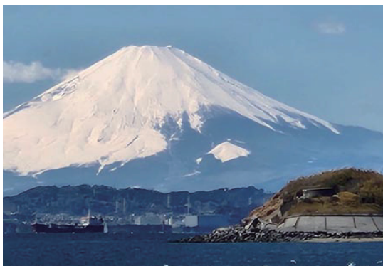
富士山の前の島は第一海堡壘です