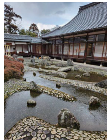
平安の雅「曲水の宴」を偲ぶために 作られたお庭だそうです。