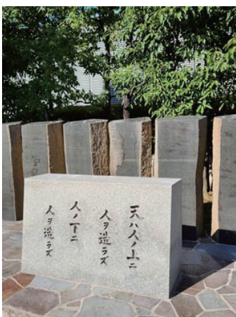
上に立つ人の偉さがわかる