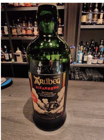
アードベック 私の好きなウイスキー（レア物）