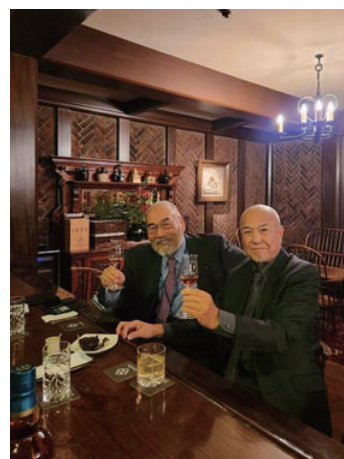
45年付き合いしている友人 （茨木ロータリークラブPP） リーガロイヤル（リーチパー） 木のぬくもりに触れる隠れ家バー （くつろぎます）で友と再会