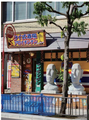
タイ式酒場（男の酒場）