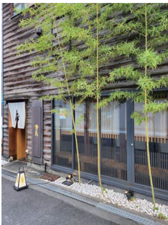
曾根崎新地梅田燈花（個室和食） 雰囲気の良い店

また、大阪の商店街はほとんどアーケードが付いており、雨降りでも、買い物ができとても良いです。天神橋筋商店街は天神橋から北は6丁目まで歩くのには、40分はかかります。長さは2 kmあり、日本一長い商店街です。一度は行って見て下さい。シャレた店もたくさんあります。大阪に行くようになっておいしいと思うようになった物（タコ焼き）大阪のはうまい！！また、堂島大橋の橋飾塔にはブロンズメタルが取り付けられていたが、戦時中に供出されたと言う戦争、争い事はいやですね。平和でありますように。