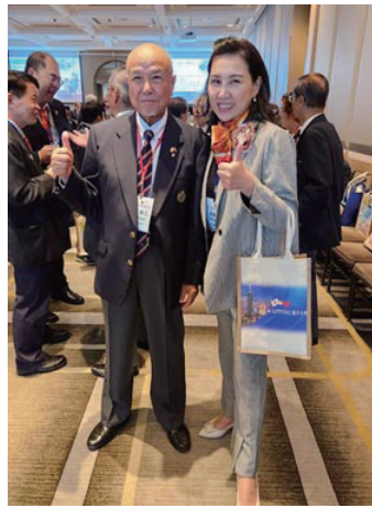
台湾のロータリアン、美しいですね