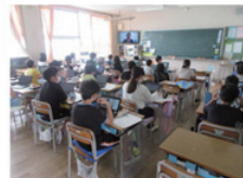
実際の授業の様子

生徒たちから「消費者として自立することを楽しく学べた」、「消費者意識にいろいろな意識があることがわかった。詐欺などに注意したい」、「消費者の1人として責任を持って行動したい」などの感想を頂きました。