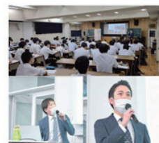
実際の授業の様子

授業に参加した大学生からは「独立系のPFIはどのように新規顧客を獲得するか」「今後、絶対的インフレは起きるか」「芸術や美術品による資産ということがあるのか」「大学生に買って欲しい商品があるとしたら何に投資しますか?」など、質疑応答の時間ではその熱気山の質問を頂きました。