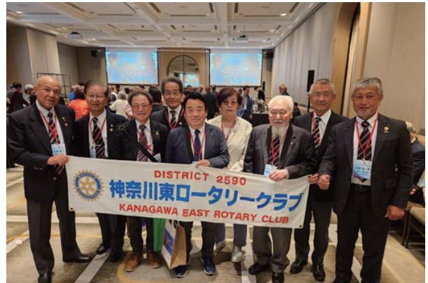
台北会場にて、神奈川東RCここにあり