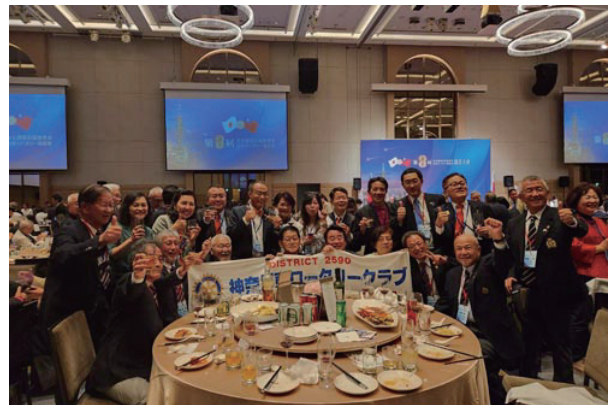
台湾のクラブの面々と盛り上がりました