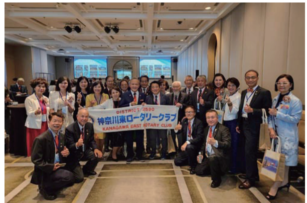
台湾の元RI会長 黄其光氏（中央）を囲んで記念撮影