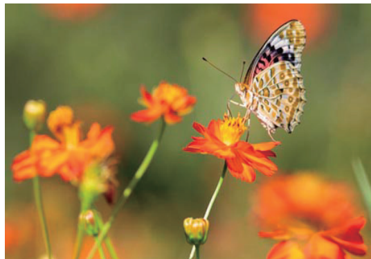
キバナコスモスに舞う蝶