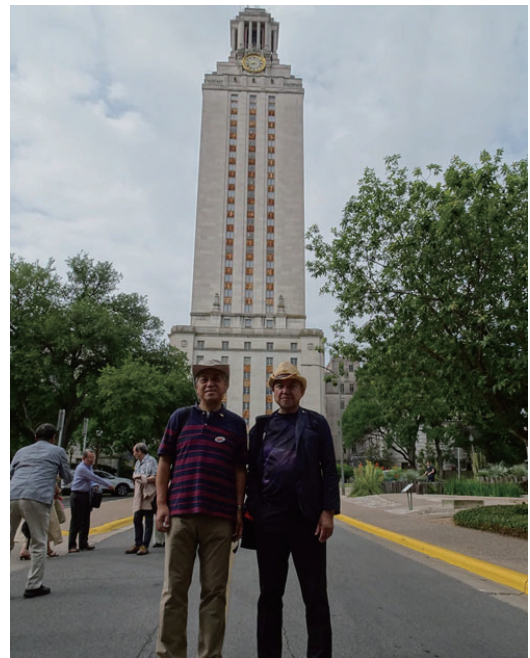
テキサス大タワーにて