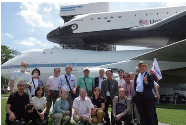
スペースシャトル前にて