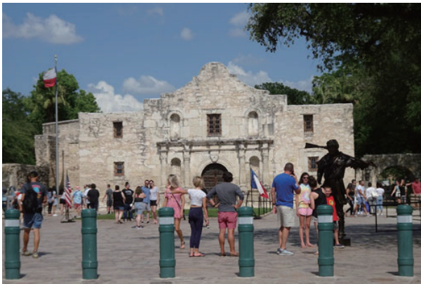
世界遺産アラモ砦