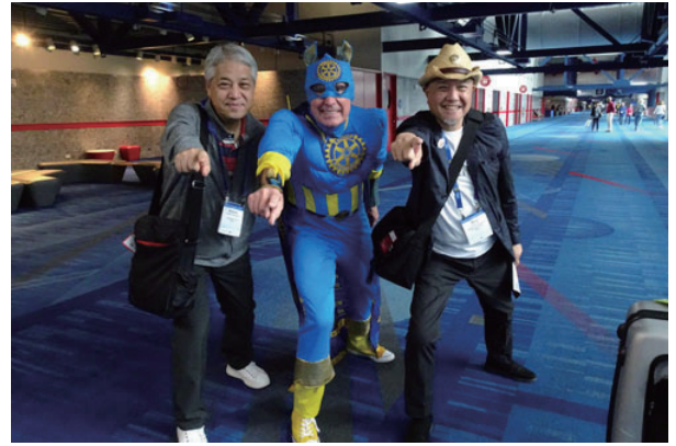
キャプテンロータリー