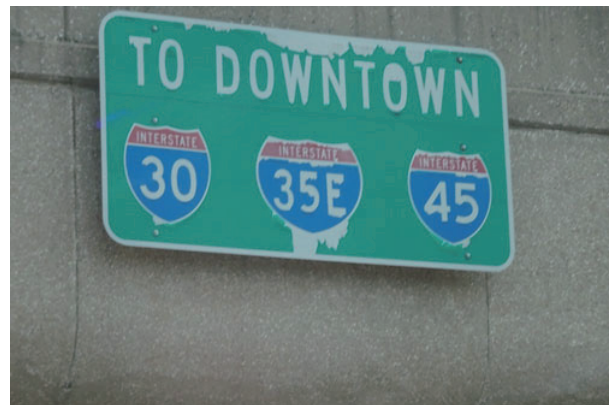
フリーウェイのサインボード