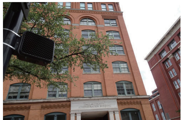
ケネディ暗殺の博物館