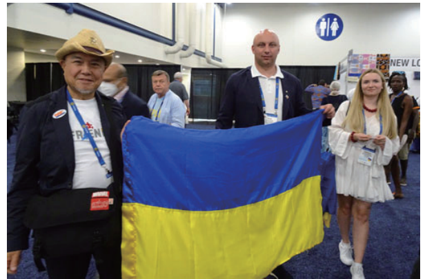
ウクライナのロータリアン