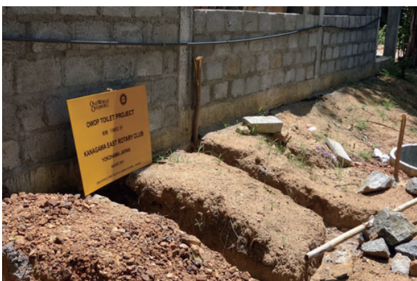
神奈川東RCの寄付で作っているトイレ。まだ未完成

神奈川東RCが、長年取り組んできた井戸、また水の問題は、スリランカの皆様方に変感謝されております。一度、クラブの皆様もスリランカに出向いて、我クラブの行っているボランティアをご自身の目で実感して頂ければ幸いです。