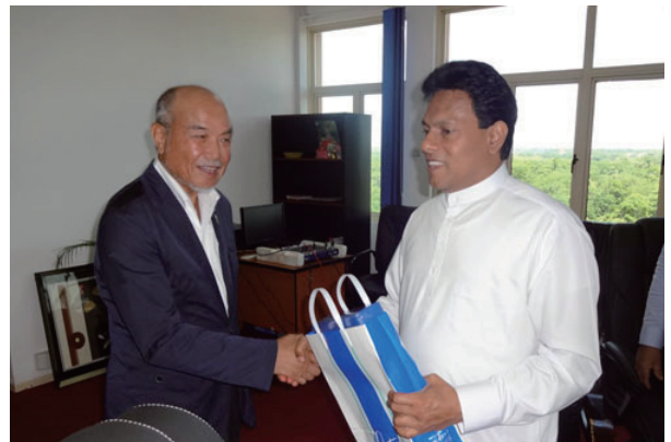
クラブからのお土産を渡しました