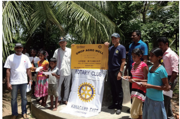
貧しい農家三世帯がこの井戸を使うことになり、大変感謝しておりました