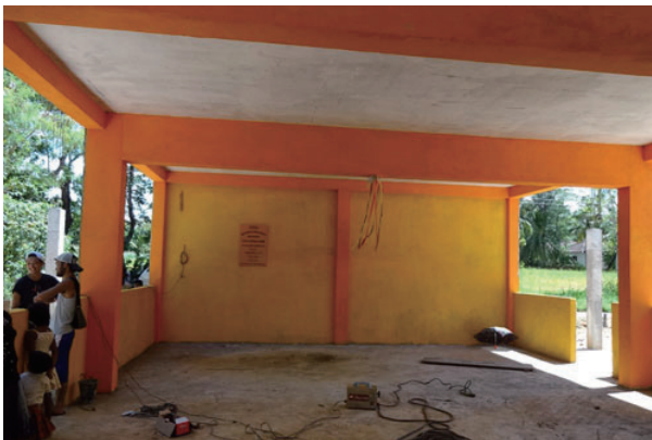
他のボランティアクラブが建てている幼稚園。50坪位で百数十万円だそうです