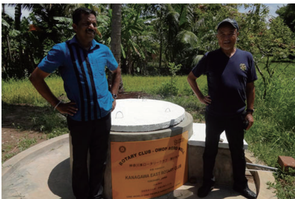
幼稚園の横に掘られている神奈川東RCの井戸。水をモーターで幼稚園にひいております