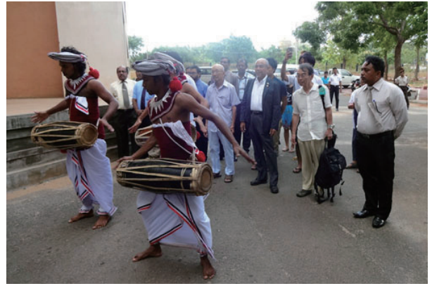
北中央州の公社前で歓迎されました