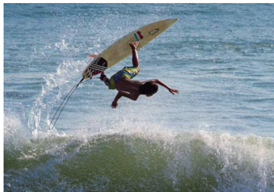
終わりになき夏 サーフィン