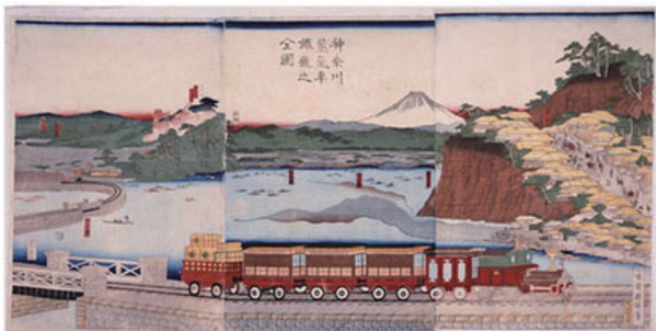
二代目歌川国輝 神奈川蒸気車鉄道之全図 明治3年(1870)12月

安政6年(1859)6月、横浜が開港されると、文明開化のスピードは加速した。明治5年に、横浜・品川間に鉄道が開業するが、浮世絵師は時代に先駆けて煙を上げて走る蒸気車を絵の中に走らせ、いち早くその様子を人々に伝えようとした。画面右が神奈川宿の台町、崖下の波打ち際は現在は埋め立てられて、横浜駅とその周辺の繁華街となっている。