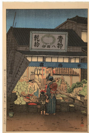
石渡江逸 神奈川子安町所見(八百屋の店) 昭和6年(1931)9月