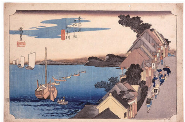
歌川広重 東海道五拾三次之内 神奈川 台之景