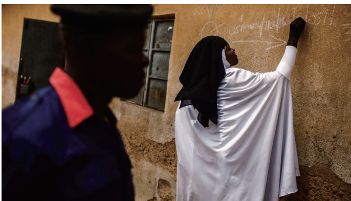
子どもたちが家におらず、再訪問が必要であることを書き記すポリオ予防接種ボランティア(ナイジェリア、カノにて)

「平和ならポリオ撲滅活動もずっと容易になりますが、だからといって平和を待っているわけにはいきません。ポリオをなくすために今できることをしなければならぬのです」