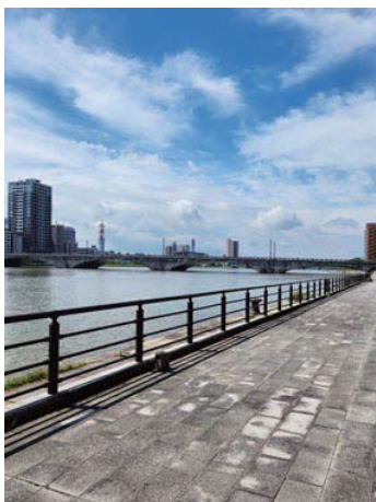
川の奥に見えるのが歌にもなっている 萬代橋で川は日本一の大河「信濃川」 です