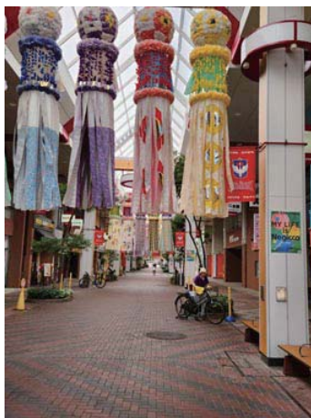
新潟の七夕まつりは6月30日～7月23日 までやりました