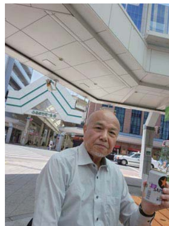
昨日の酒はどこへやら。 商店街で朝酒うまい！！