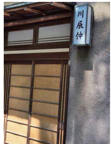
古町芸妓さんは花代1名2時間が目安。 川辰中（かわつつなか）昭和初期の芸妓（げいぎ）置屋 古町花街の100年前の置屋がみられる貴重な建物です。