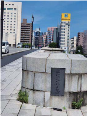
萬代橋は昭和四年6月竣工された