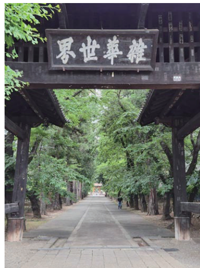
山門に「雑華世界」とかいてありますが何と読みますか。惠林寺では「ざかせかい」と読むようです。

さて、クラブは本日が2220回目の例会ですが、私は1983年（S58）10月、321回目の例会がスタートですので、私としては今日が丁度1900回目の例会出席となります。今年10月になりますと、ロータリー歴も40年になります。あと何年続けられるかわかりませんが、何卒皆様ヨロシクお願い致します。