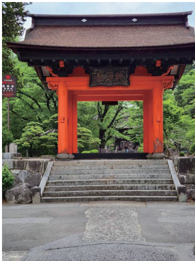
恵林寺四脚門（通称赤門）