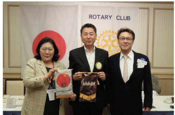
ビジターでお越しの東京丸の内RCとバナー交換