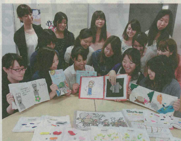
▲ 手作りの教材を並べる学生たち。「何を作ろうか、という発想力も身につきました」と話す(京都市の同志社女子大)