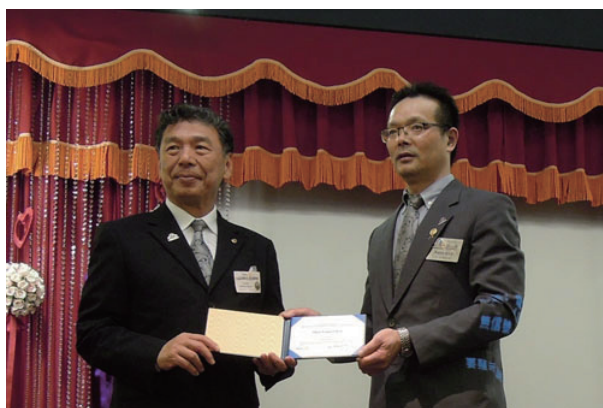
ガバナーと陳水源会長