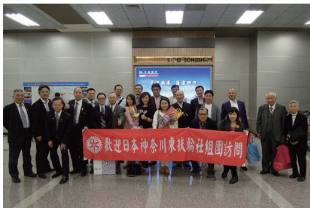
台北松山空港にて熱烈歓迎

4月13日（水）、台北滬尾ロータリークラブの『創立10周年記念式典』に出席して参りました。当クラブからは、会員・夫人合わせ、8名が出席。また今回は、七ヶ浜ロータリークラブからも4名が出席致しました。