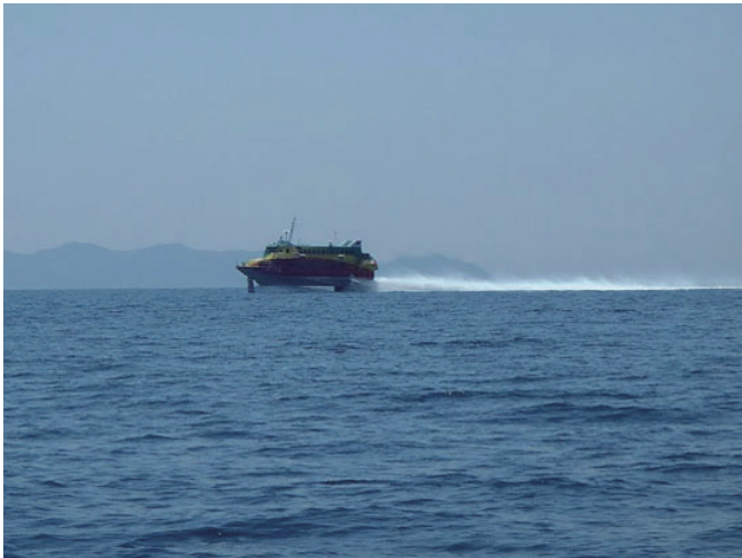
慕進！高速ジェット船（東京湾口）