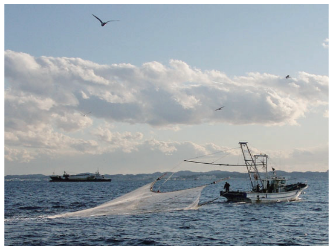
東京湾の代表的な底引網漁