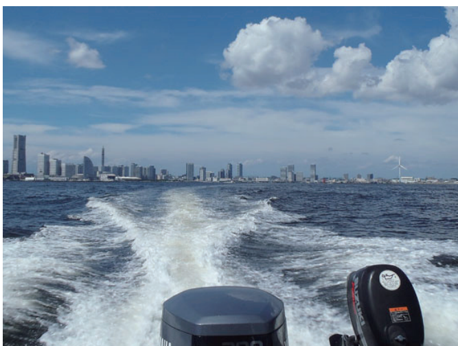
これ、横浜港の景色ですよ！