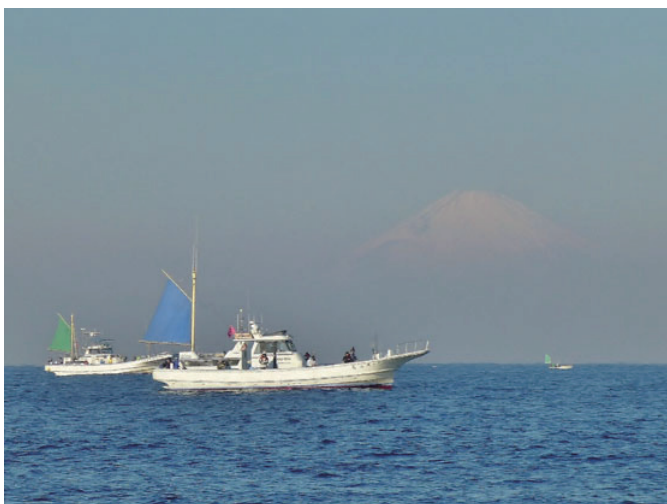
のどかな～ 葉山の沖