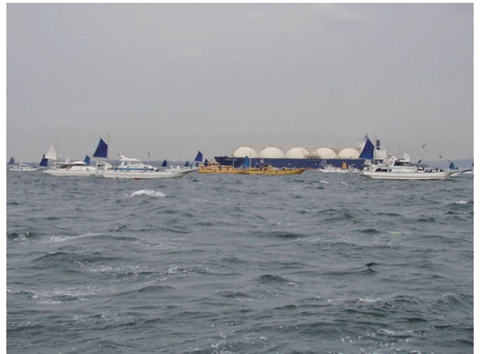
本船航路は大混雑