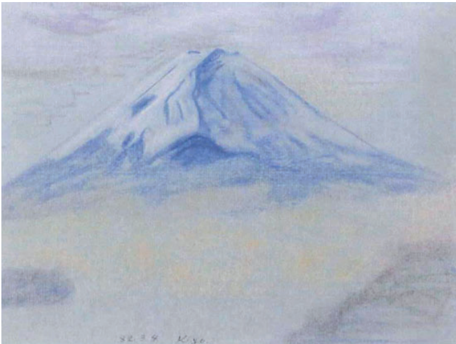
パウル・クレール 「パルナツソス山」1932年