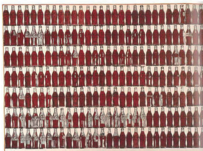
ピエト・モンドリアン 「グリーンコココーラボトル」1962年