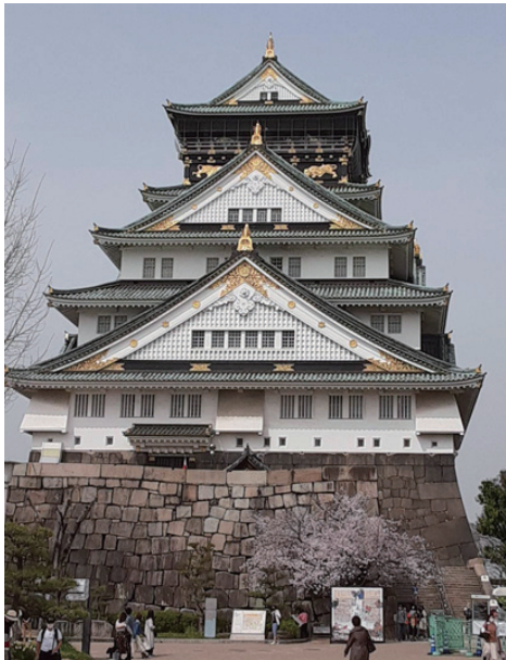
大阪城の桜です。城と桜がマッチしてきれいです。