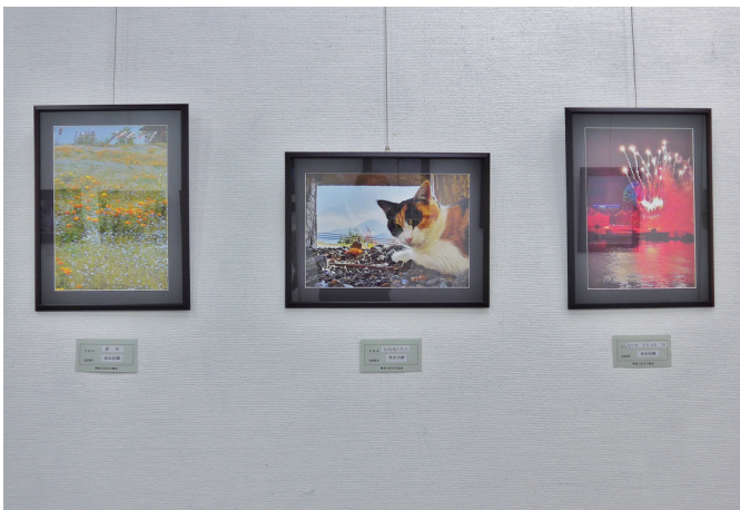
出品者 角田 伯雄 会員