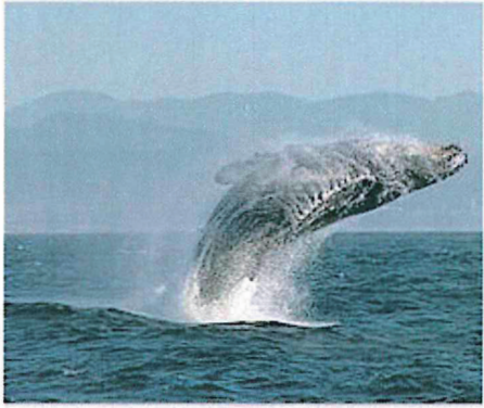
ザトウクジラ (ウィキペディアより)