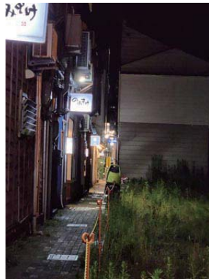
皆様の好きな裏小路