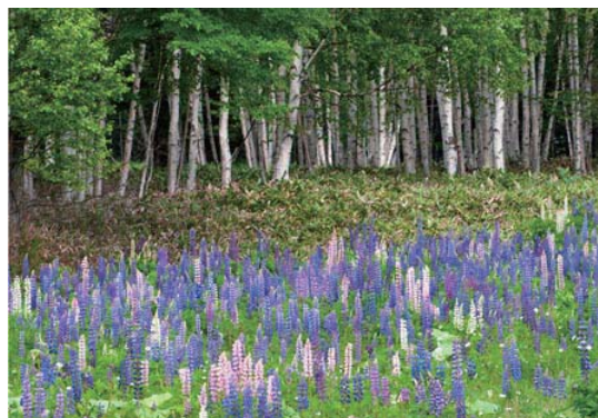
白樺林に咲くルピナス