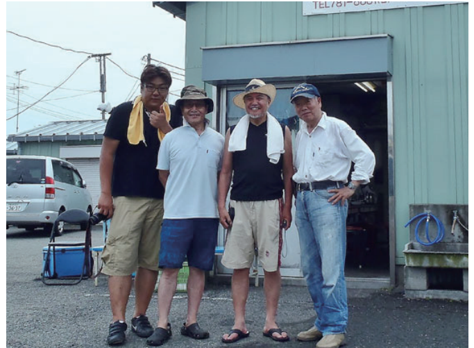
写真・記事提供 小池将夫会員