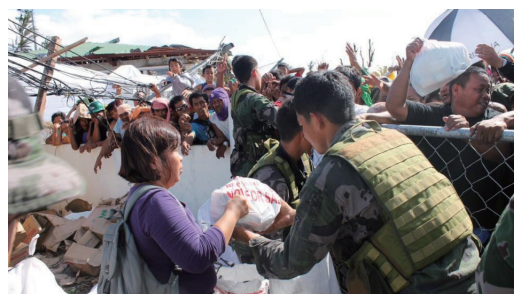
ロータリーニュース