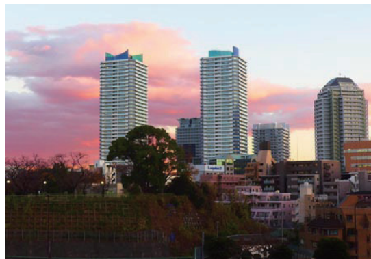
夕暮れの神奈川区