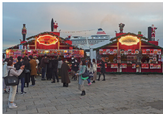
クリスマス パージョン