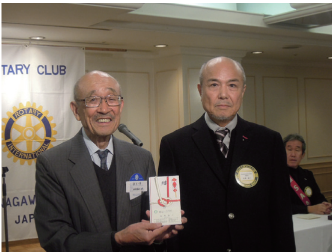
アローメディカル(株)より寄付金贈呈