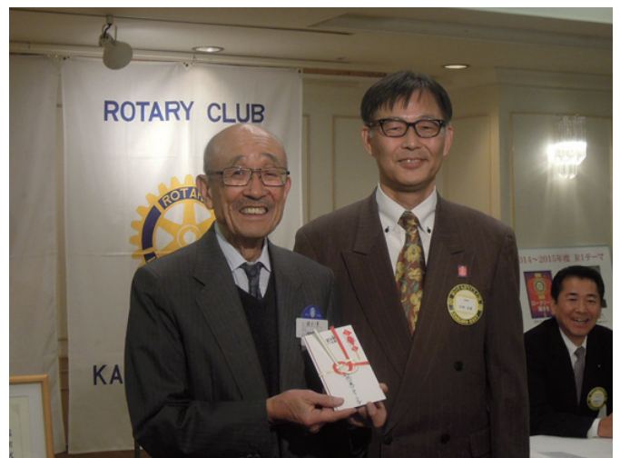
クラブより寄付金贈呈