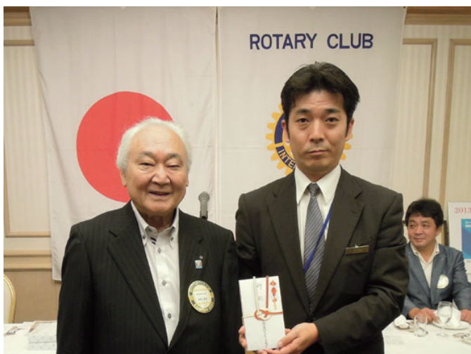
ホテルへ謝礼贈呈