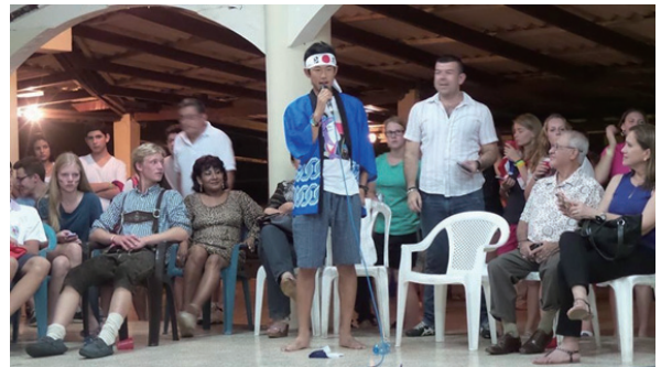
タレントショーにて