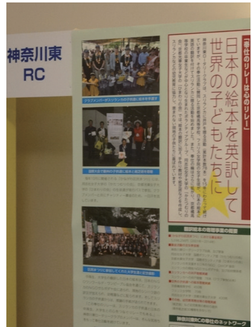
大会展示～青少年関連活動展