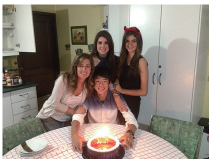
ホストマザー、ホストシスターと一緒に

今回のキャンプが終わって、家に帰ってから気づいたのですが、携帯の充電器や眼鏡、カメラなど自分の不注意でなくしてしまいました。タレントショーの疲れがたまっていたこともあって、完全に気付かませんでした。2度と同じ過ちを繰り返さないように、常に気を付けていきたいと思います。