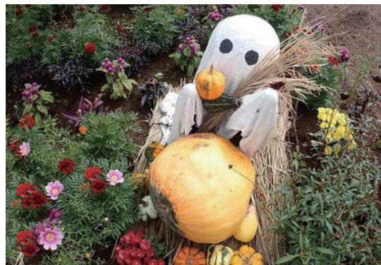
お花畑のハロウィン