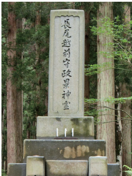
長尾政景公の墓所