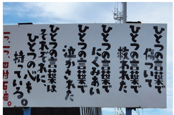
ガソリンスタンドにあった気になる言葉