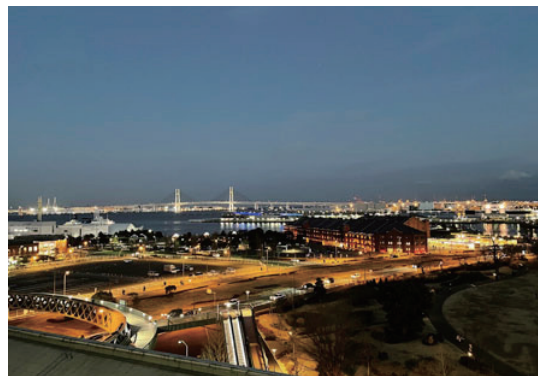
夕暮れのみなとみらい