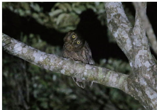
リュウキュウコノハズク